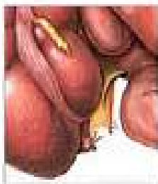
برداشتن آپاندیس با عمل جراحی